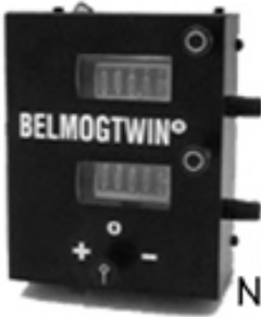
Belmogtwin MK II BELMOG New Belmogtwin